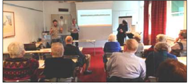
Tre personal från Capio, Henån.