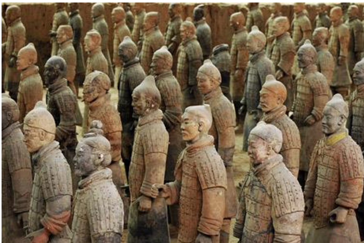
Terrakottaarmén bevakar en av de kinesiska kejsarnas grav. Utgrävningarna pågår ännu.

I december besökte vi Östasiatiska museet i Stockholm och guidades genom utställningen om Kinas terrakottaarmé, se bild nedan. Utställningen var mycket intressant och alla deltagare tyckte att resan var lyckad, trots en del strul med lunchen.