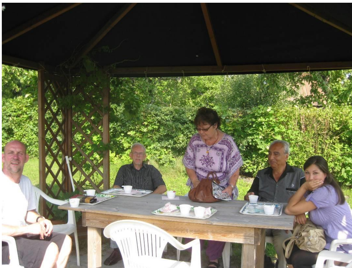
Kaffepaus vid Härkeberga kyrka i augusti 2010.