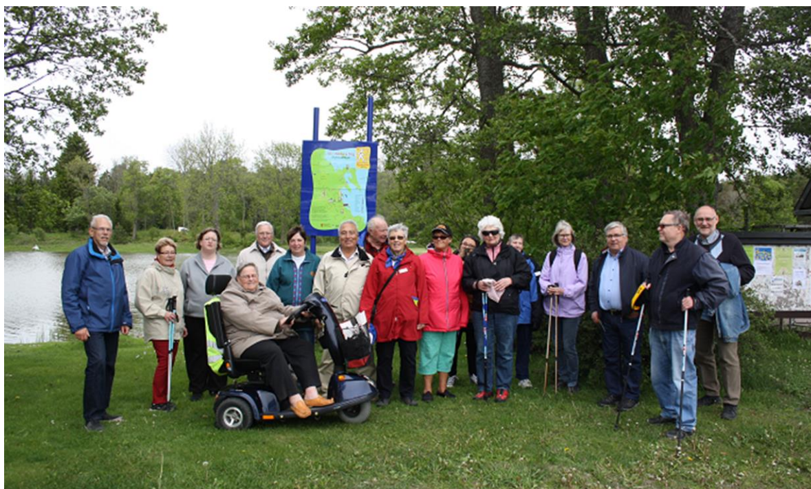
HjärtLung föreningarna i Tierp och Östhammar på gemensam promenad utefter Hälsans Stig i Östhammar i juni 2015.