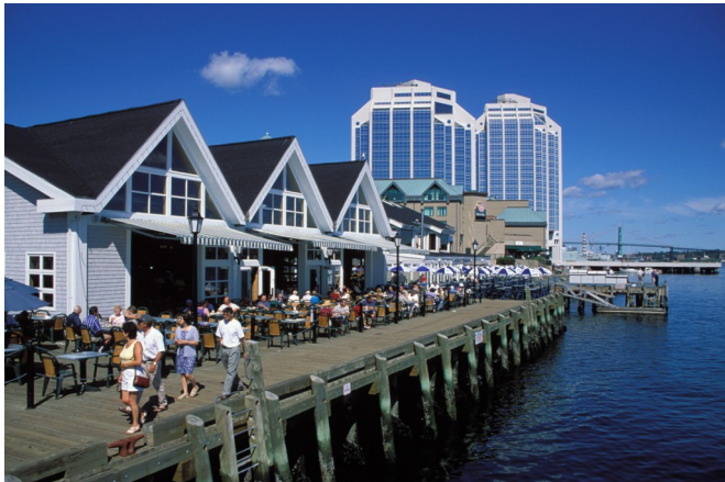
Hamnpromenaden i Halifax

Kl:07:30 lägger båten till i Halifax. Underbart väder, så det blir en rundtur och en promenad, en trevlig stad.