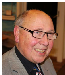
Ordförande har ordet Från månadsmöte den 1 oktober