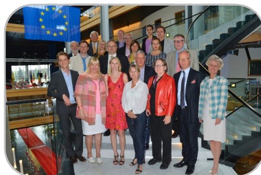
De svenska ledamöterna

Europaparlamentet stiftar EU-lagar, godkänner EU:s budget och kontrollerar EU-kommissionen. Informationskontoret vänder sig till allmänheten och till dig som arbetar med att bevaka eller granska EU och dess beslutsfattare. Vi informerar om vilka uppgifter Europaparlamentet har, hur det arbetar och om de beslut som parlamentet fattar. Informationskontoret representerar Europaparlamentet som institution och inte något särskilt svenskt eller politiskt intresse.