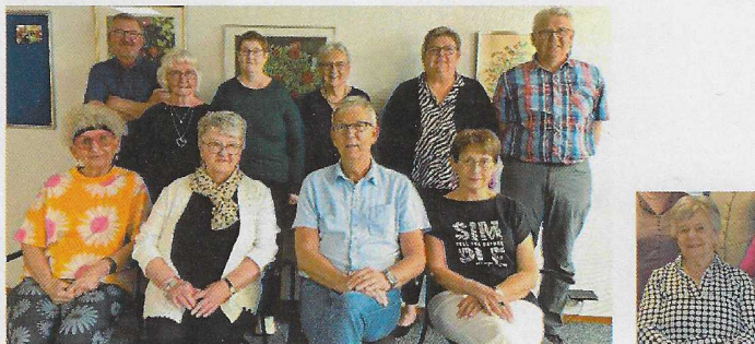
Styrelsen i Riksförbundet HjärtLung Ljungby 2026.