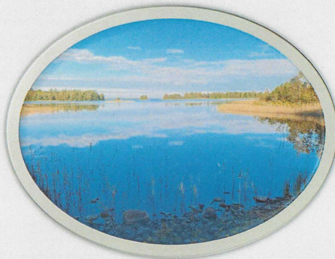
Bild från vandring i samhället Bolmen.