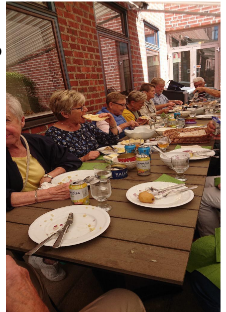
Här frossas det i den jätta delikatessen..

Som en del av er vet så har våra ” medlemsmöten med soppa ” inte kunnat fungera som planerat och någon lösning finns inte inför våren, i dagsläget. Det sista datumet som är inbokat, onsdag 11 november serverar vi istället kaffe och smörgås kl. 14.30 på Rubinen Väsby centrum. Pris 30 kr. Vi kommer även då att ha en inbjuden gäst. Vem det blir är inte bestämt. Varmt Välkomna.