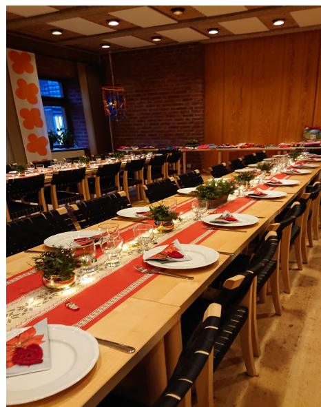
Dukningen är färdig..