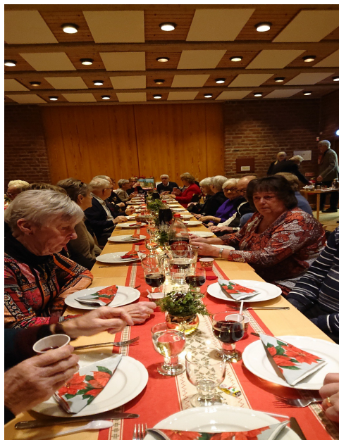
Gästerna har tagit plats.