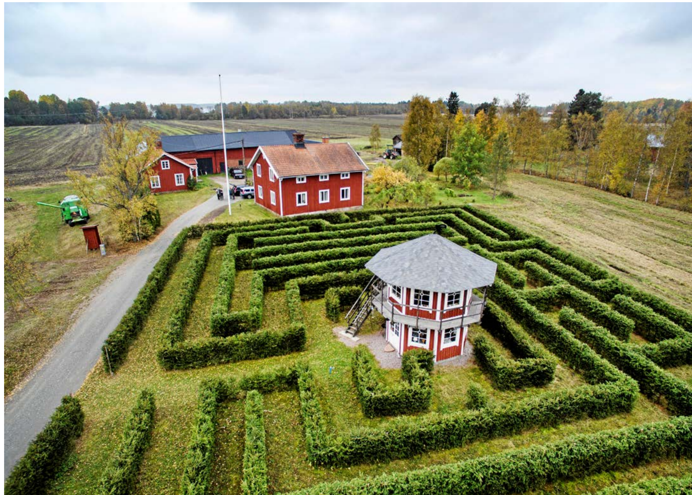
Labyrintens väggar av gran är en meter och åtta centimeter höga.

Helge sätter sig och demonstrerar. Rummet i markplan en trappa ner är inredd som en bar, med barbord, höga stolar och väggfasta kafébord med långhåriga färfällor på sitsarna. Där har de haft många fester och middagar med släkt och vänner. Men också skolbarn och andra studiebesök som