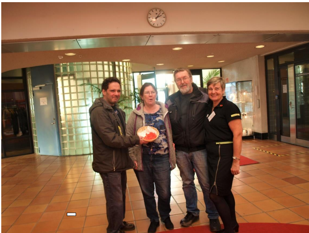
Besök från lokalavdelningen HjärtLung Nacka-Värmdö