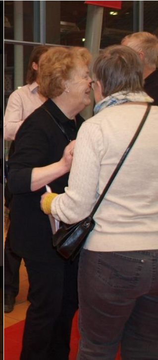
Britt informerar om ICD inopererad hjärtstartare