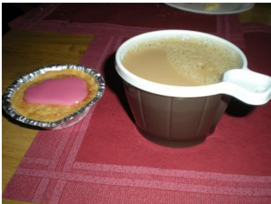
Gerd och Gunnar sjunger för fulla muggar: