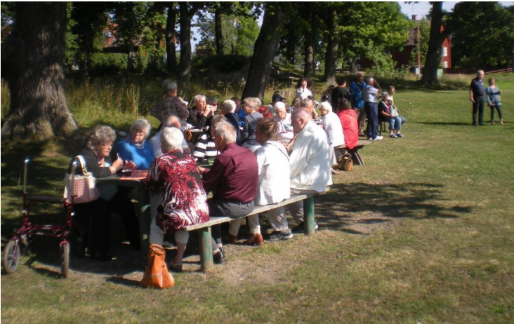
Bild: Mysigt kaffestopp i Gripsholms Slottspark.

Vi åker till Gripsholms Slottspark och stannar där för morgonkaffe med hemgjorda smörgåsar. Solen skiner och det är en mycket vacker morgon i augusti.