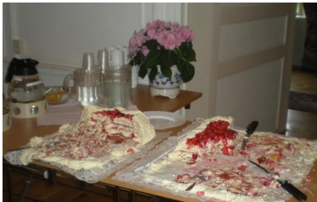
Bild: Här är allt som blev kvar av tårten.

Där vi bjuds på kaffe med ljuvlig hembakad jordgubbstårta.