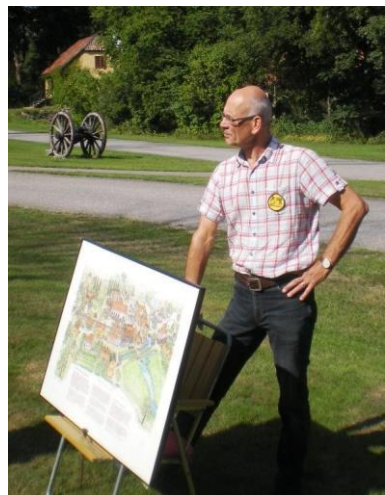
Bild: Den mycket trevliga guiden som berättade för oss om Åkers Styckebruks historia.

Sedan rundvandring på museet och möjlighet att titta på gamla sparade föremål.