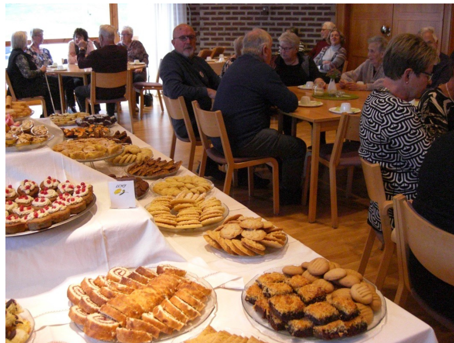
Välbesökt musikcafé med kakfrossa