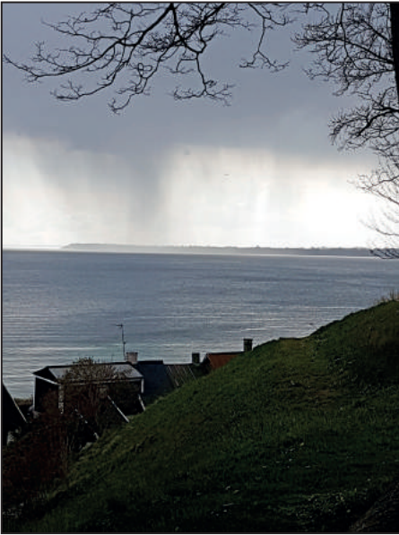
Utsikt från kanten av slottsparken med delar av fiskeläget Ålabodarna nedanför och Ven ute i sundet.

på slottet med omnejd. Till vissa platser utomhus skickades de med "piggast" ben medans resten av lagmedlemmarna fick vila och njuta av utsikten, naturligtvis öppnade sig himlen under skattjakten men det stoppade oss inte.