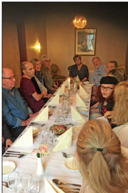
I väntan på middagen.

rätt (små chokladpraliner, macarons i olika färger och en liten parfait med färska lingon). Det var en MYCKET god och TREVLIIG middag och vi "rullade" efter detta från bordet och slottet ner till receptionen igen. Dags att öppna skattkistan !!