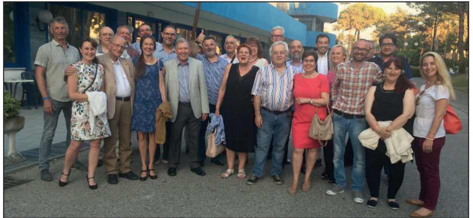
Hela delegationen i Lignano

Lördagsmorgonen var det strålande sol och varmt. Efter frukost var det dags att lyssna på olika föreläsare som fick 10-30 min var-