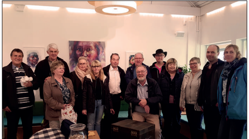
Hela gänget samlat utom Annki samt fotografen med medhjälpare.

Efter detta var vi väl värda en middag på slottet. Middagen bestod av förrätt (soppa) varmrätt (kyckling eller lax) samt efter-