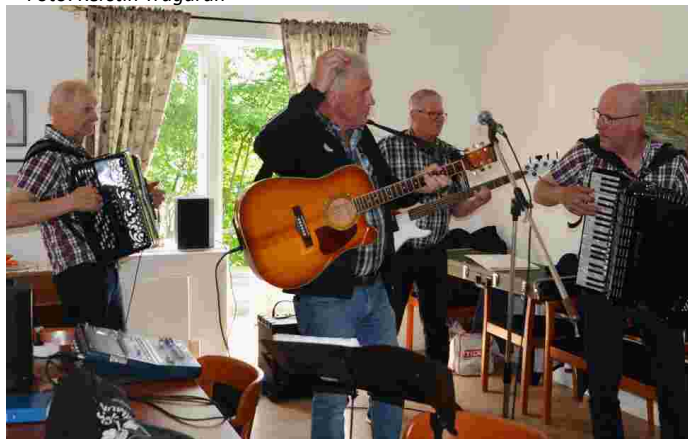
Glad underhållning av Jernbrukarna