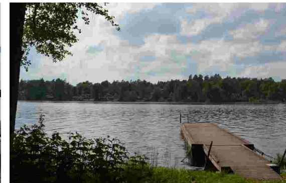
Utsikt från två av bryggorna på näset - ut mot den blå Mälaren