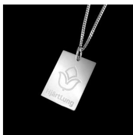
Rektangelformad, halsband 50 cm

Länk direkt till webbshopen: http://webbshop.hjart-lung.se/