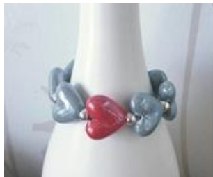
Bild på hjärtearmbandet bandet i grått och rött

Armbandet levereras i organzapåse. Pris: 150 kr/st