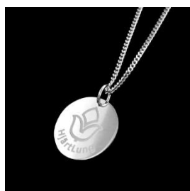
Cirkelformad, halsband 45 cm

Smycket levereras i en presentask. Pris: 320 kr/st.