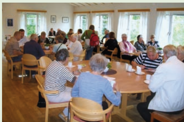
Kaffepaus med dopp.