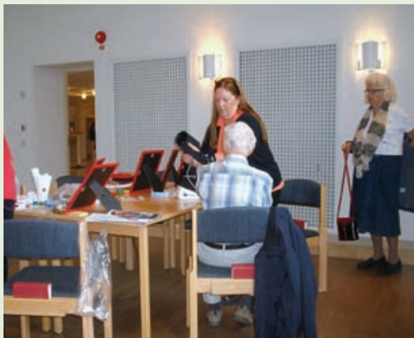
Kontroll av Blodtryck.