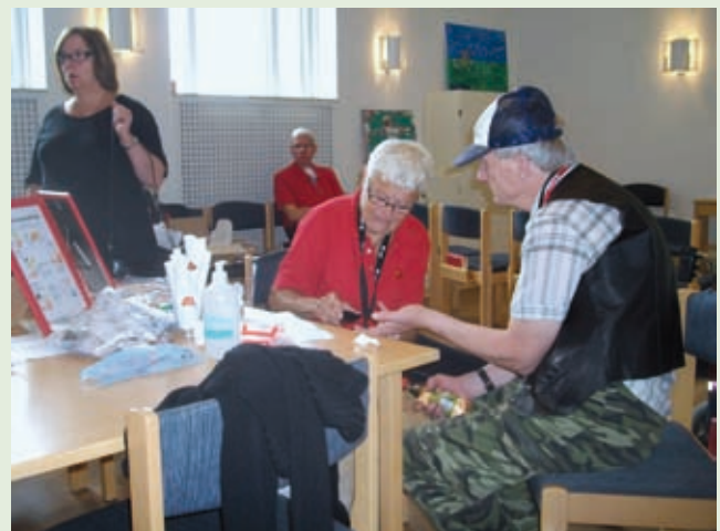
Kontroll av Sockervärdet.