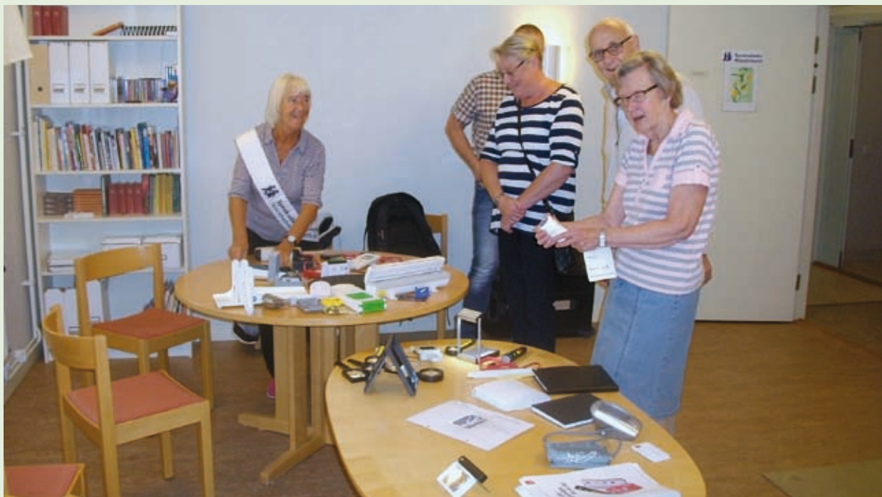
Prova din hörsel.

Ja, så var det dags igen för Hälsans dag i Botkyrka-Salem, ett evenemang som nu har blivit en tradition. Hälsans dag är ett samarbete mellan HjärtLung och flera andra föreningar i kommunen.