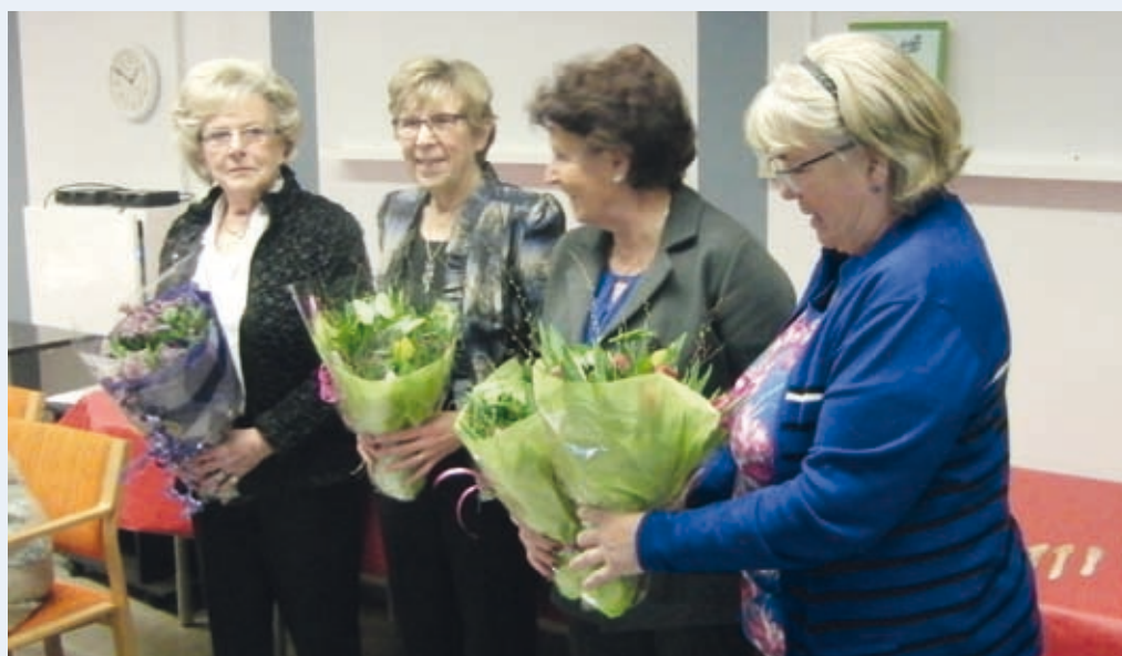
Avtackningar med vackra vårbuketter.

Innan dagen avslutades serverades vi kaffe med kaka. 📖