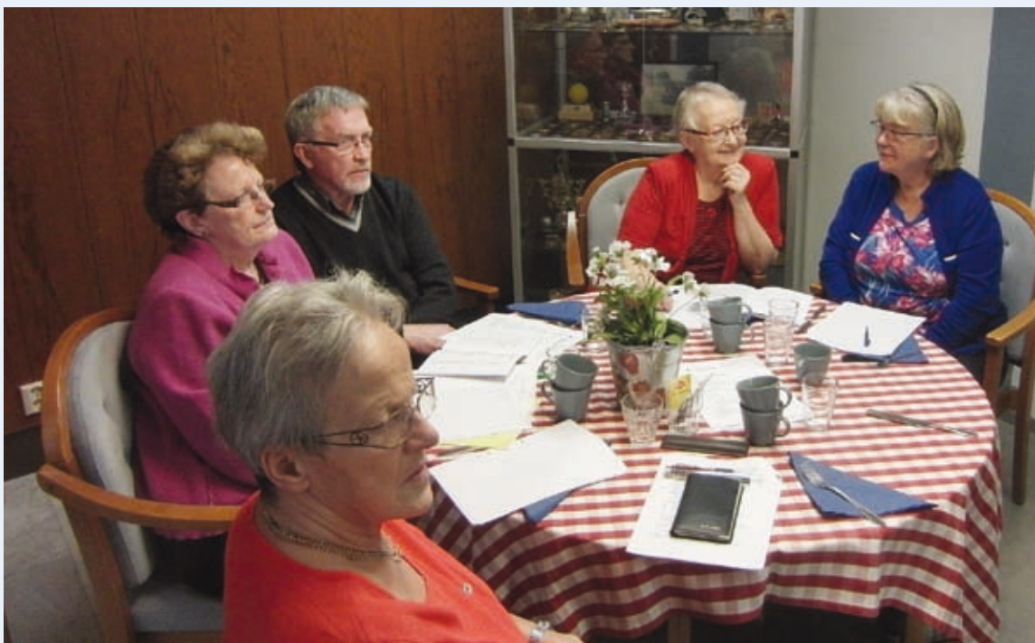
Några av våra 44 medlemmar.