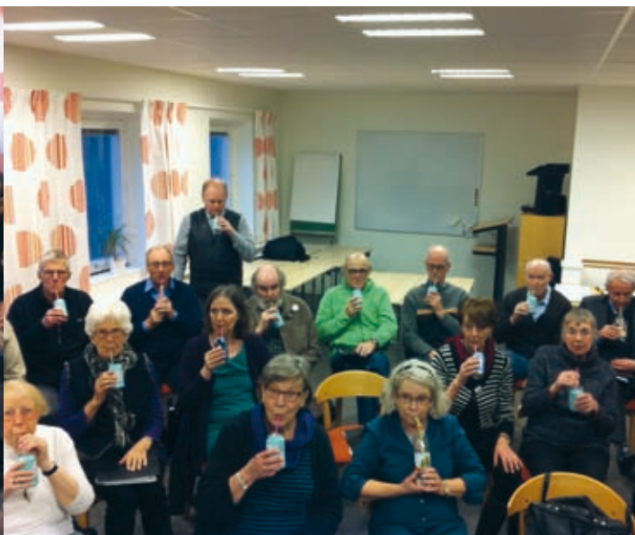
...och nu släpper vi ut luften långsamt genom sugröret och vattnet i burken bubblar.