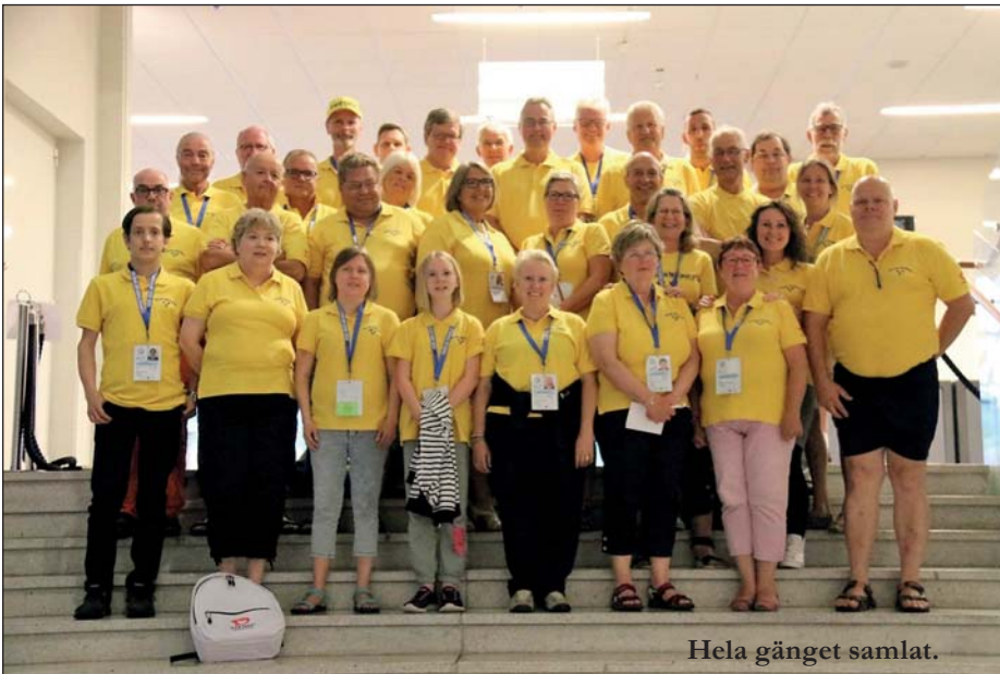
Hela gänget samlat.