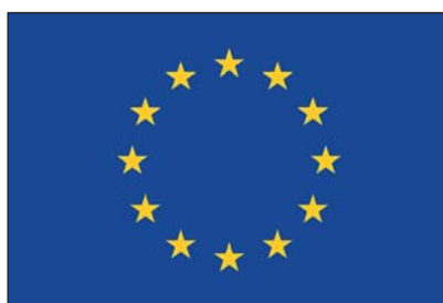
Projektet är finansierat av EU, Vinnova samt sjukvården.