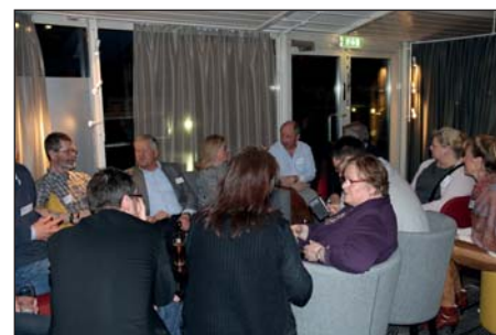
Kvällssamvaro